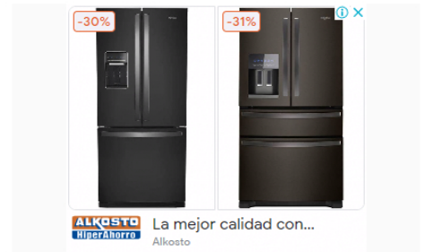
Alkosto La mejor calidad con... Alkosto

“Una empresa en la que el Estado y el sector privado puedan trabajar conjuntamente en el desarrollo de prácticas para promover la seguridad territorial, la industrialización y la competencia entre las empresas que hacen parte del sector”, describe el Ministerio de Minas y Energía.