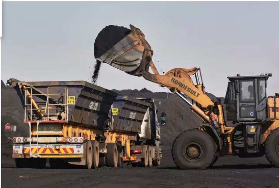
Congreso aprobó creación de Ecominerales, la 'Ecopetrol' del sector minero: ¿qué viene ahora? Imagen de archivo. Ecominerales será la encargada de impulsar una nueva política minera, de ser aprobada en el Congreso.

El proyecto de ley fue aprobado en primer debate por la Comisión Primera de la Cámara de Representantes. Conozca la iniciativa y lo que le depara en la próxima legislatura