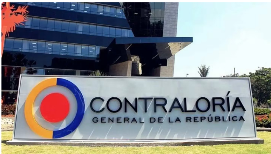
Sede de la Contraloría La Contraloría había hecho comentarios a proyecto de ley para crear Ecominerales.