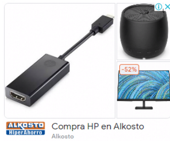
Alkosto Compra HP en Alkosto Alkosto

Uno de los primeros en celebrar el primer visto bueno de la iniciativa en el Congreso fue justamente el ministro de Minas y Energía, Andrés Camacho, con una publicación en X.