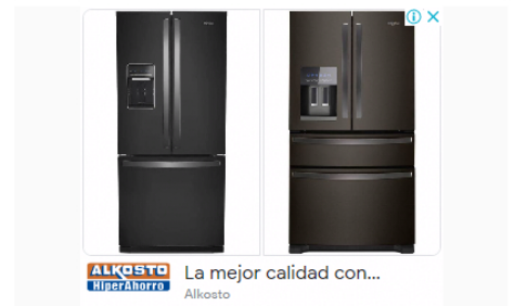
Alkosto La mejor calidad con... Alkosto