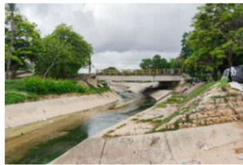
Instalan 50 geobags, para contener corrientes de arroyo El Platanal en Soledad