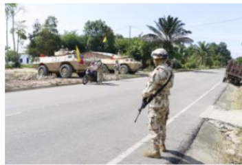
Fortalecen seguridad en el sur de Bolívar, por combates entre grupos armados