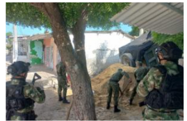
Ejército apoya intervención técnica del arroyo de Villa Merly