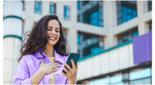
GoBravo Paga tus deudas con cuotas más bajas