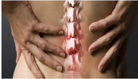
Artheros Las personas con dolor de espalda y cadera tienen que leer esto