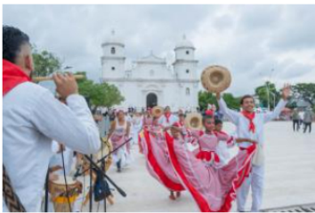
Cero riñas y homicidios durante las fiestas patronales en Soledad