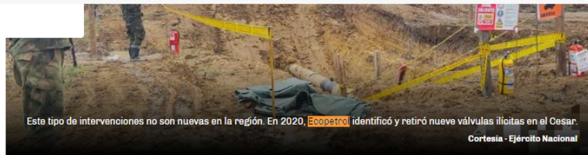
Este tipo de intervenciones no son nuevas en la región. En 2020, Ecopetrol identificó y retiró nueve válvulas ilícitas en el Cesar.