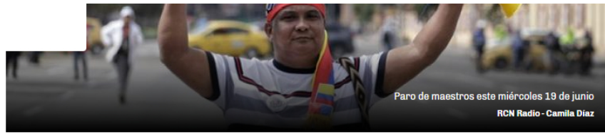
Paro de maestros este miércoles 19 de junio RCN Radio - Camila Diaz