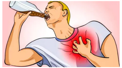
Imvital Médicos: ¡Quitenlo de su dieta y su hipertensión desaparecerá!