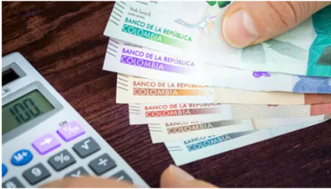
GoBravo Mejora tu futuro financiero con la prima