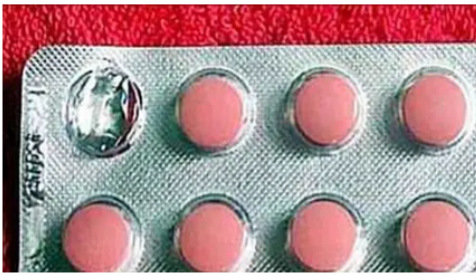
Vimital Esta pastilla olvidada limpia las venas a un ritmo impresionante