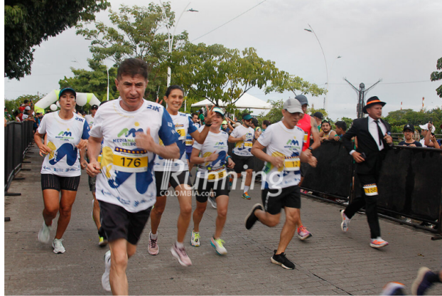
La carrera pasará por el Monumento al Cristo Petrolero

Y para hacer realidad el sueño de muchos, de conocer su majestuosa infraestructura, orgullo de los colombianos, la carrera partirá de la Villa Deportiva, frente a las piscinas del Imdera, para posteriormente pasar por el tradicional Club Infantas, la sede social de los empleados de la principal empresa del país, e ingresar a las instalaciones de la refinería, por la puerta 25 de agosto, y hacer un recorrido de tres kilómetros por sus instalaciones, pasando por la unidad de balance y la Plazoleta de la Iguana.