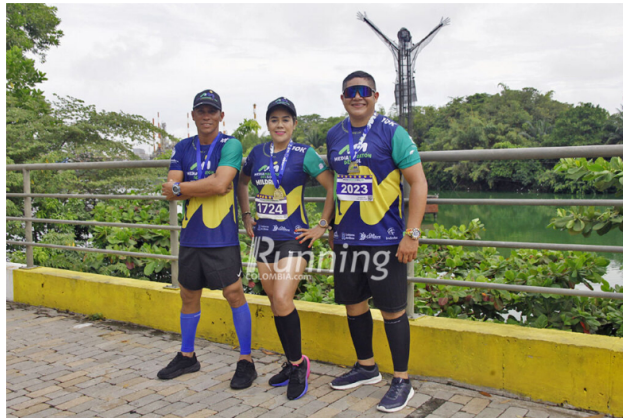
La mejor recompensa para los corredores es la medalla y la postal con el Cristo Petrolero de fondo

ETIQUETAS Barrancabermeja media maraton Media Maratón del Sol