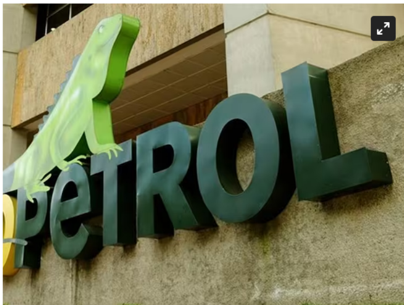
Ecopetrol intensifica actividad para fortalecer oferta de gas natural en el oriente del país

La iniciativa es liderada por Ecopetrol y tardará un año su ejecución