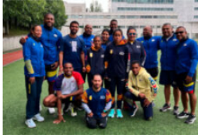
Preparada la delegación colombiana para el Grand Prix de Paris