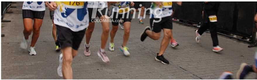
La carrera pasará por el Monumento al Cristo Petrolero

Al salir de la refinería, se toma nuevamente la Avenida Circunvalar, por el sector del Club Infantas, para luego pasar por el Comando de Policía del Magdalena Medio, antes de tomar la calle 60, donde está el monumento de la Pollera Colorá, y después pasará por el Cristo Petrolero , otra de las atracciones de Barrancabermeja y lugar obligado para la foto con la medalla.