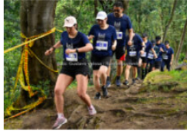
Cuenta regresiva para el Trail Urbano de Bogotá 2024