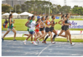
Avanzan las inscripciones para los Juegos Interscholásticos 2024