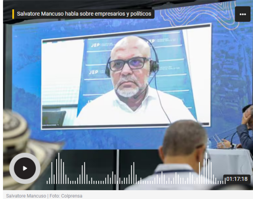
Salvatore Mancuso

El jefe máximo de las llamadas Autodefensas Unidas de Colombia aseguró en El Reporte Coronell que Luis Carlos Restrepo ordenó la muerte de Vicente Castaño.