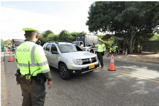
Proyecciones realizadas por la Secretaría Distrital de Movilidad indican que para este fin de semana festivo saldrán de la ciudad 998.700 carros y motos e ingresarán a la ciudad 994.700 vehículos

La Secretaría de Movilidad, para este fin de semana festivo, puso en marcha un operativo especial en los corredores de salida e ingreso de Bogotá, para garantizar el éxodo y retorno seguro de los miles de viajeros que saldrán hacia otros municipios y ciudades del país.