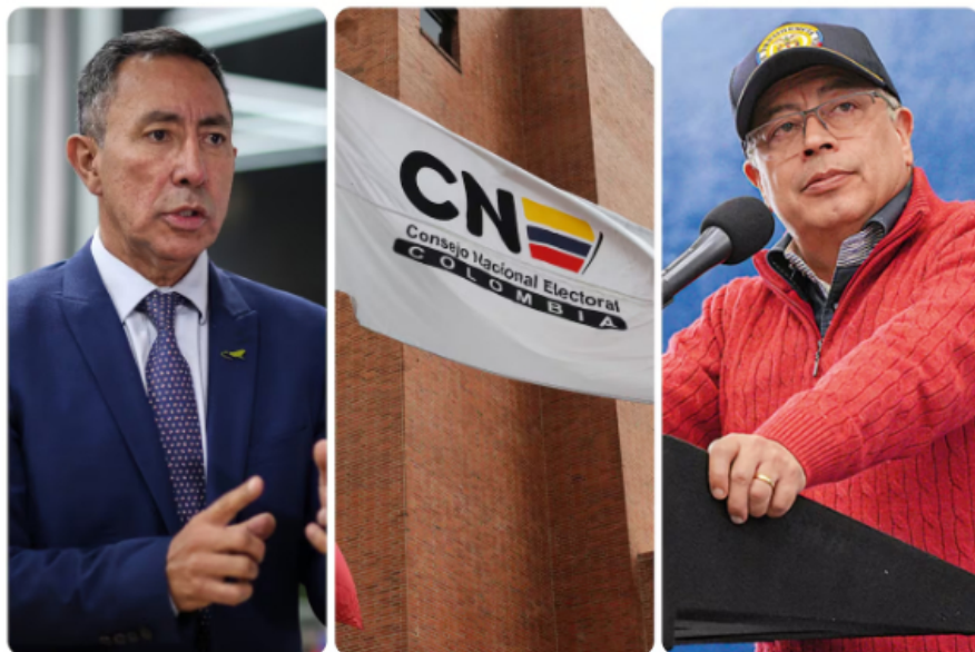
El presidente de Ecopetrol, Ricardo Roa, y el presidente de Colombia, Gustavo Petro. | Foto: Esteban Vega/Archivo/Presidencia

En el CNE, Roa también precisó: "Nos sobró plata de la que recibimos de las fuentes de financiación y, lógicamente, fue retornado a la Cooperativa Confiar. Le devolvimos, si mal no recuerdo, unos 3.800 millones de pesos. No recuerdo los montos con exactitud, creo que habíamos definido como 8.500 millones como cupo para gastos de la campaña. Creo que nos habían prestado 7.000 millones y les devolvimos casi 3.700 millones".