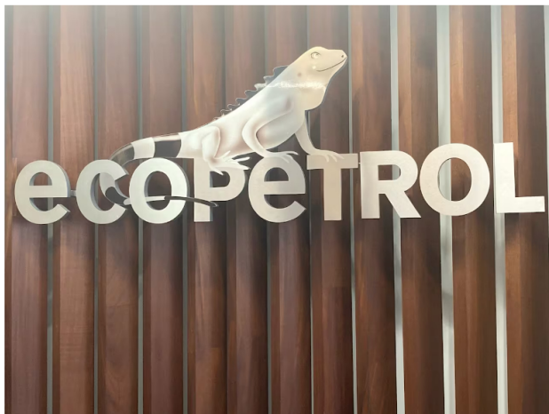
Los cambios propuestos entrarán en vigencia a partir del 1 de julio.

Con la decisión, se buscaría que la empresa pueda contar con una organización más ágil y eficiente. Además de ello, buscaría fortalecer sus líneas de negocio y diferenciar entre las actividades relacionadas con dirección y ejecución, a la par de mantener retornos competitivos.