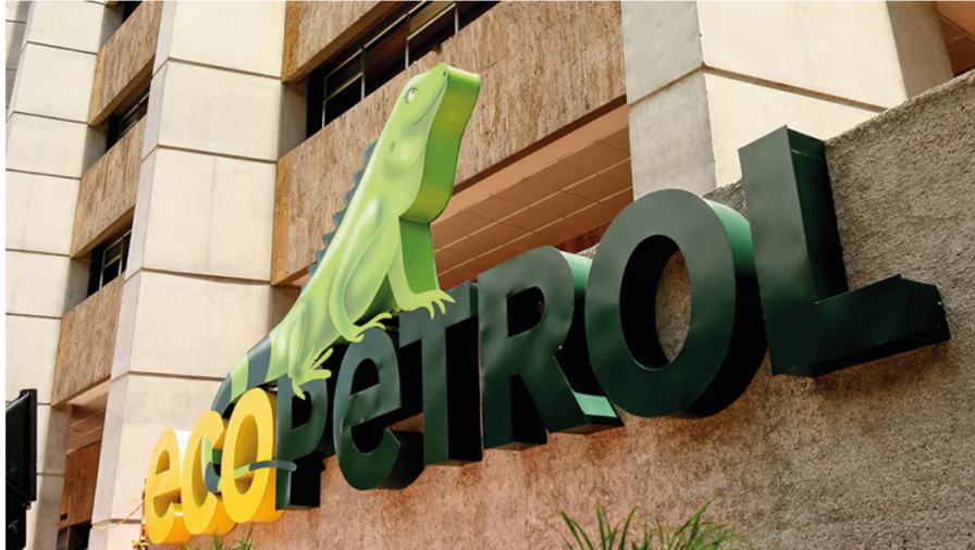
Ecopetrol anunció nuevos cambios en su estructura organizacional.

Ecopetrol es una de las empresas más importantes del país. La petrolera, con décadas de historia, es una de las compañías que mayor cantidad de dólares irriga en la economía colombiana, por cuenta de las ventas de crudo en el exterior, que normalmente se hacen en esta divisa. De hecho, el Estado colombiano, es propietario de más del 80% de la empresa, por ello, su comportamiento afecta directamente las finanzas nacionales.