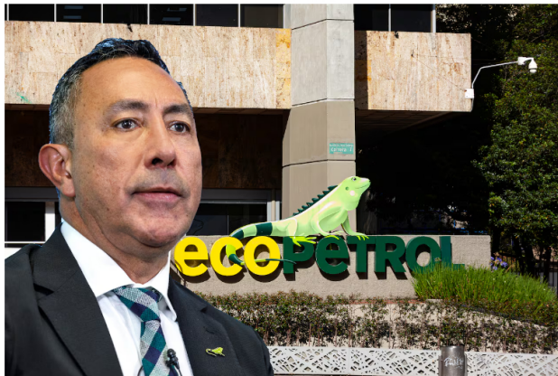
Ecopetrol cambiará los nombres de varias de sus vicepresidencias, así como sus funciones.

Durante las últimas semanas, Ecopetrol no ha traído buenas noticias, pues registró una caída en utilidades que superó el 40%. De acuerdo con su presidente, Ricardo Roa, la situación correspondió a algunas fluctuaciones en el mercado del dólar y también a los precios del petróleo en el mercado internacional.