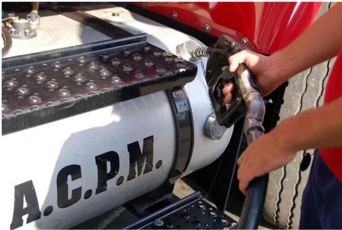
La subida del diésel no afectará a los transportes masivos

La medida afecta principalmente a grandes empresas petroleras, de carbón y aquellas que manejan grandes camiones. El ministro Bonilla mencionó que los transportadores están preocupados por este incremento, destacando que “los taxistas y camioneros están sobredimensionando el tema porque ellos transportan todo tipo de bienes y no solo alimentos” .