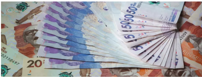
El déficit del Fepec ha cargado las finanzas del Estado

La actualización de los precios se realizará mediante un decreto que alinearé los precios locales con los estándares internacionales. Sin embargo, el ministro aclaró que el incremento no afectará a los transportes masivos ni a las regiones no interconectadas que dependen en gran medida del diésel.