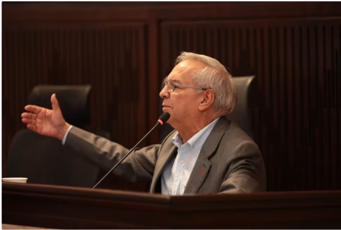
El ministro de Hacienda reveló medidas económicas para contrarrestar el recorte presupuestal anunciado por el Gobierno

El ministro de Hacienda, Ricardo Bonilla, anunció que el precio del diésel incrementará gradualmente para grandes consumidores en Colombia. Esta medida forma parte de las estrategias del Gobierno para estabilizar las finanzas nacionales, en medio de un complicado panorama fiscal.