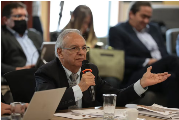
Bonilla confirma que no se recortarán programas sociales

En relación con estos ajustes, el ministro también reconoció que las metas de recaudo planteadas inicialmente fueron excesivamente optimistas. "Las metas de recaudo que estuvieron planteadas fueron excesivamente optimistas. Hoy estamos afrontando la situación de que no se van a lograr" , manifestó.