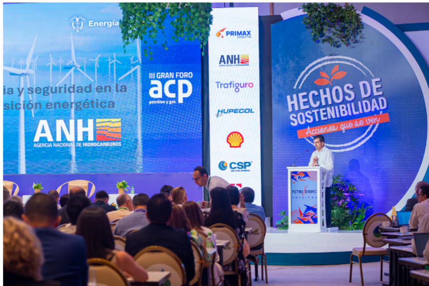
Orlando Velandía, presidente de la ANH, se refirió a la situación actual del sector petrolero.

"No nos llena de tranquilidad eso, lo que nos llena es de unos desafíos enormes de cómo hacemos para superar esas contingencias y al finalizar de año muchos de esos recursos contingentes ya los llevamos en reservas y poderle cambiar esa tendencia que han venido en los últimos 10 años sobre todo en materia de gas decreciendo nuestras reservas", conduyó.