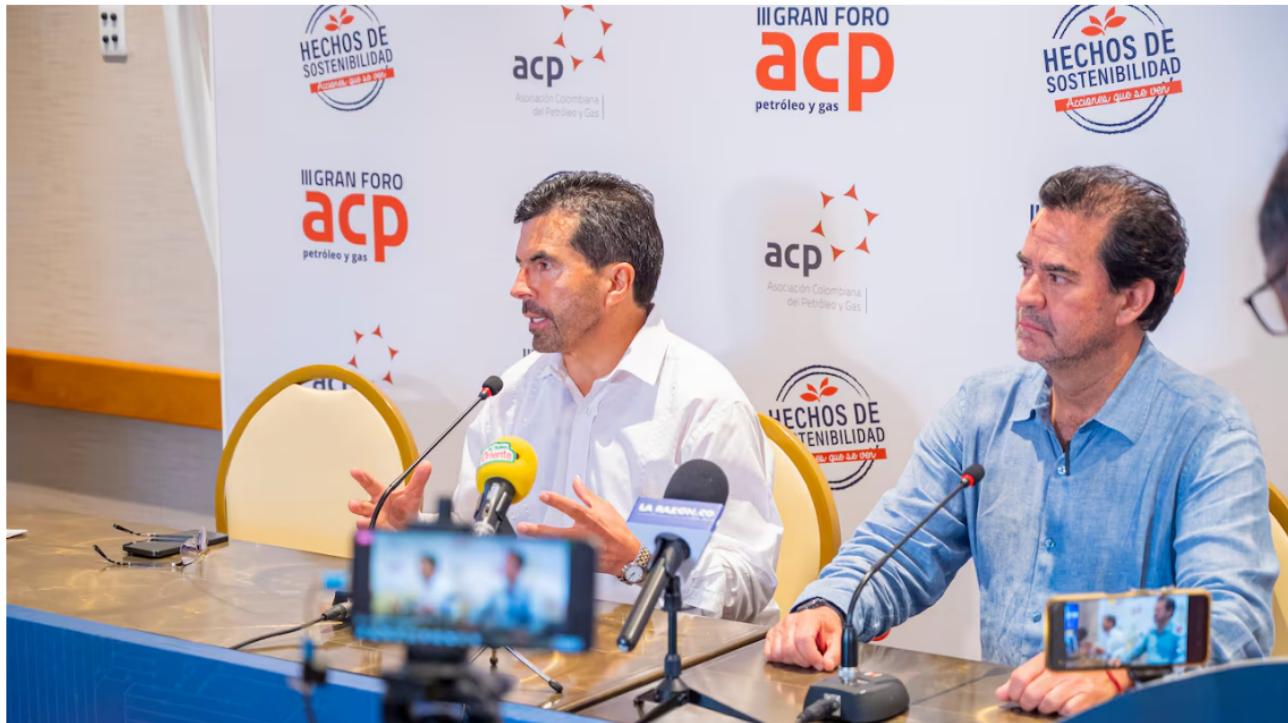
Orlando Velandía, presidente de la ANH, se refirió a la situación actual del sector petrolero.

Hace algunas semanas, la Agencia Nacional de Hidrocarburos presentó oficialmente las cifras de reservas con las que cuenta el país con corte al 2023. Los números ratificaron