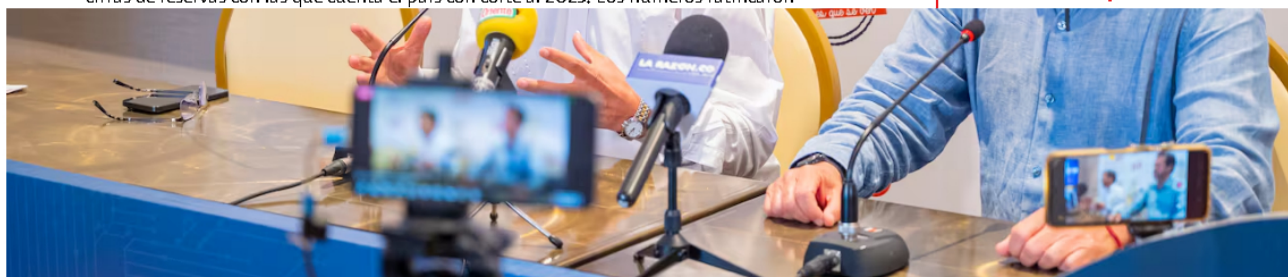
Orlando Velandía, presidente de la ANH, se refirió a la situación actual del sector petrolero.

Hace algunas semanas, la Agencia Nacional de Hidrocarburos presentó oficialmente las cifras de reservas con las que cuenta el país con corte al 2023. Los números ratificaron desalentador , al demostrar que las reservas también cayeron tanto en el sector petrolero como el gasífero. Las reservas probadas de petróleo cayeron de 7,5 años a 7,1 años. En materia de gas, el país tenía reservas de gas para unos 7,2 años en 2022. Ahora, en 2023, las reservas que quedan servirían para unos 6,1 años.