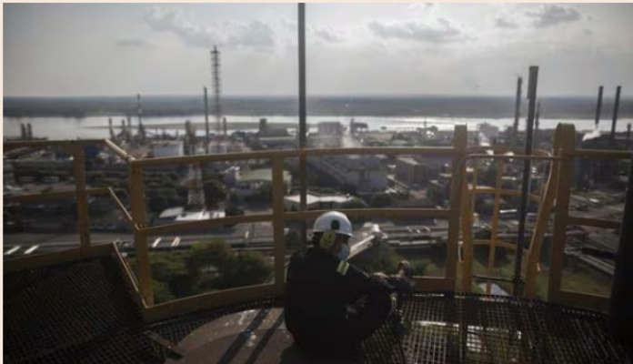
Trabajador en una refinería de Ecopetrol en Barrancabermeja.

El presidente Gustavo Petro, que ha hecho de la lucha contra el cambio climático una prioridad, se niega a conceder licencias para explorar nuevos yacimientos, a pesar de que las reservas se están agotando.