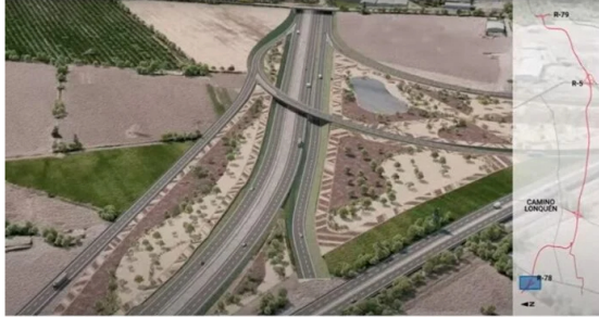
ISA (filial de Ecopetrol) logra su primera autopista urbana en Chile.

Este cuatro de junio de 2024, fue publicado, oficialmente, el decreto de adjudicación a ISA Intervial, luego de haber presentado la mejor oferta económica de la licitación realizada por el Ministerio de Obras Públicas de Chile para el proyecto "Concesión Orbital Sur Santiago".