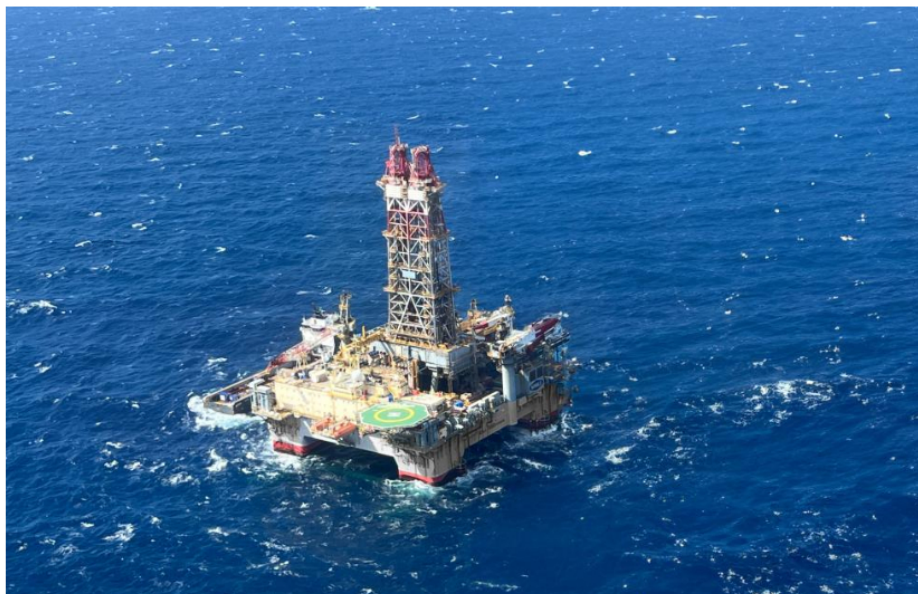
AL PARECER el pozo Orca 1 situado costa afuera en el caribe no ha dado los resultados esperados de gas.

El Pozo Orca Norte, explorado costa afuera, al parecer no tiene el potencial de gas esperado