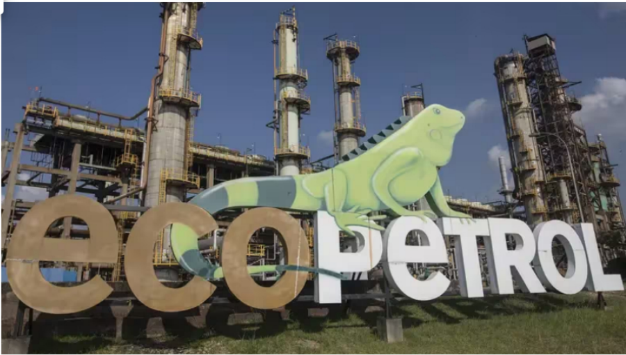
Estos son los bufetes de abogados que investigan a Ecopetrol en Estados Unidos (Ivan Valencia)

Por Daniel Guerrero | 04 de junio, 2024 | 12:00 AM