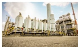
USO destaca encuentro con junta directiva de Ecopetrol