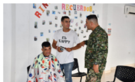
Creator de contenido realizará proyecto en hogar La Misericordia