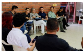
Estudiantes ITSC se mantienen en paro