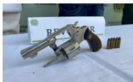
Policía realizó varias capturas en operativos realizados