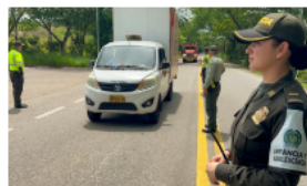
Con plan «Éxodo» policía garantizará tras operativos de la policía