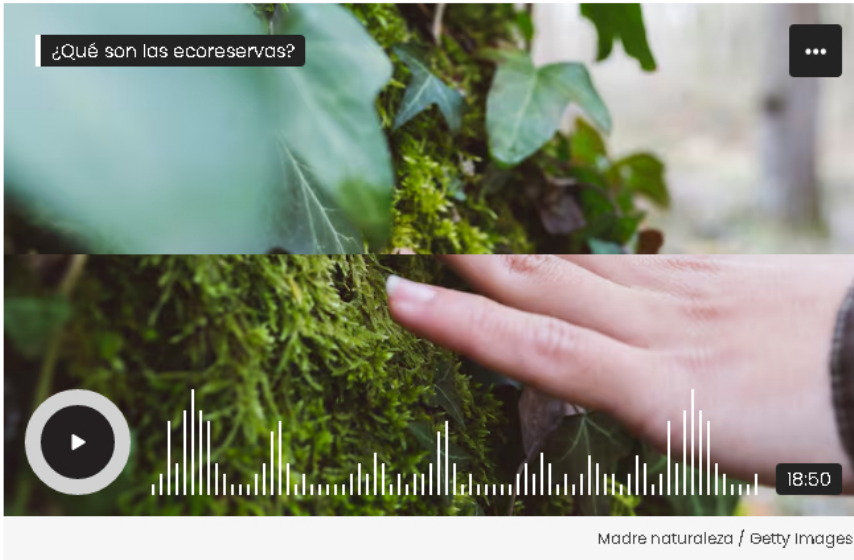
Madre naturaleza / Getty Images

Son 20 ecoreservas que suman 15.500 hectáreas destinadas a la conservación de la biodiversidad