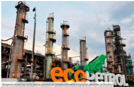
Ecopetrol obtiene luz verde para su incursión en energías renovables a través de asambleas de bonistas