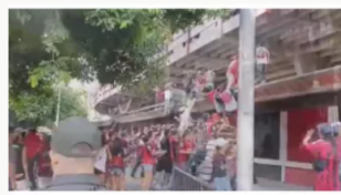
Cúcuta deportivo pierde y los hinchas generan disturbios en el estadio que dejan 12 heridos