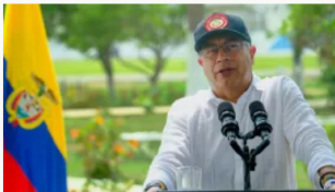
Desconcierto por asociación que hizo presidente Gustavo Petro de construcción de la ALO y feminicidio en Bogotá