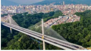
Bucaramanga en alerta por invasión de tierras y obras ilegales en zona inestable