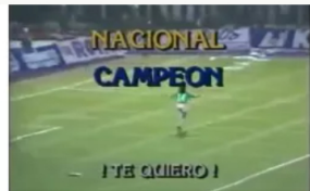
Hace 35 años Atlético Nacional ganó su primera Copa Libertadores de América: así fue su emocionante triunfo ante Olimpia