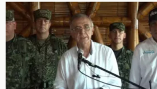
Ministro de Defensa Iván Velásquez lanza alerta por carros bomba en Colombia