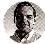
Ricardo Bonilla Ministro de Hacienda y Crédito Público

Luego de publicarse las cifras de recaudo en lo corrido del año, las cuales están lejos de las metas de la Dian y muestran un faltante de $12 billones, el centro de estudios Anif publicó un informe en el que proyecta que el hueco fiscal para 2024 alcanzaría los $26,3 billones. "Frente a este escenario retador es necesario que el Gobierno anuncie un recorte de gasto del tamaño de dicho faltante para este año. Esto enviaría un mensaje de responsabilidad fiscal y seguramente tendría un efecto positivo en los títulos de deuda pública", dijo el centro de estudios en un comunicado.