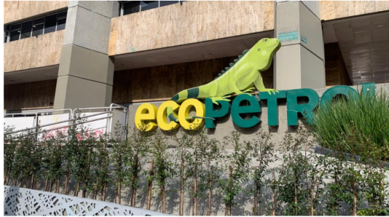
Presidente de Ecopetrol habla sobre demanda de gas y planes de importación.

Publicado: Martes, Julio 30, 2024 - 18:35 | Actualizado: Martes, Julio 30, 2024 - 18:35