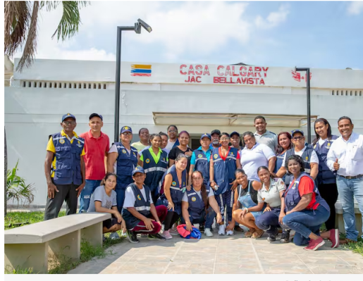
Refinería de Cartagena

La formación estuvo dirigida a organizaciones de base como Comités Barriales de Emergencia, madres comunitarias y líderes de juntas comunales