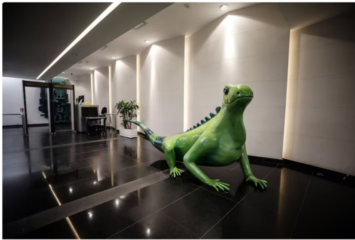
Fitch confirmó calificación de Ecopetrol en AAA, con perspectiva estable

Fitch Ratings afirmó las calificaciones nacionales de largo y corto plazo de Ecopetrol en AAA con perspectiva estable y F1+, respectivamente. También confirmó las calificaciones de la emisión de bonos por COP$1 billón en AAA: