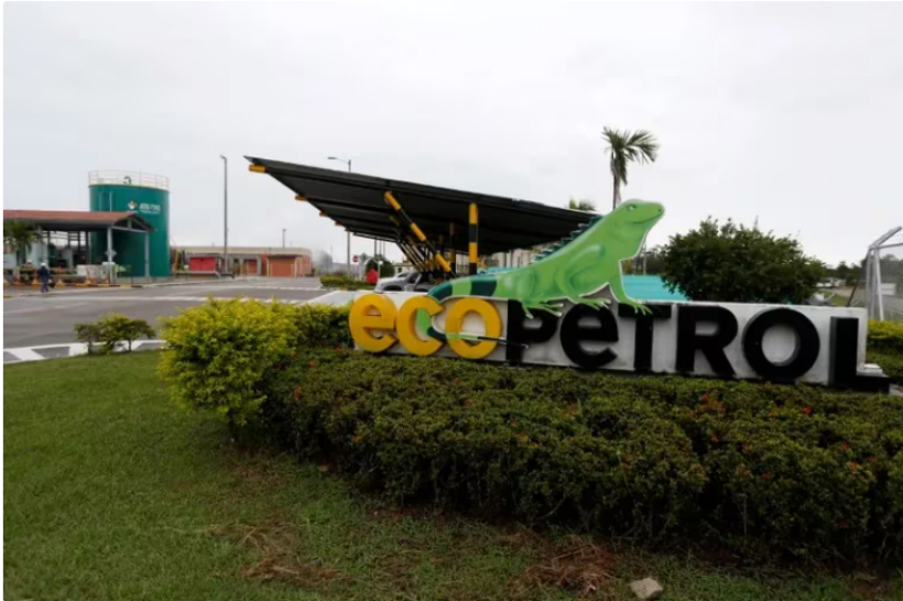
Ecopetrol es la empresa estatal más rentable de Colombia. El Gobierno busca una transición hacia energías limpias y dejar de depender del petróleo

De acuerdo con el Gobierno, la transición será gradual y tendrá cinco ejes