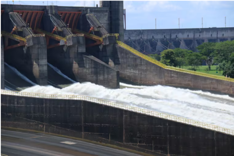
Colombia busca avanzar en su meta del uso de energías renovables

El plan de transición energética es uno de los puntos clave del Gobierno del presidente Gustavo Petro, que incluye exploración y producción de petróleo y gas para garantizar la autosuficiencia de la matriz energética, la diversificación de las fuentes y las acciones para enfrentar el cambio climático.