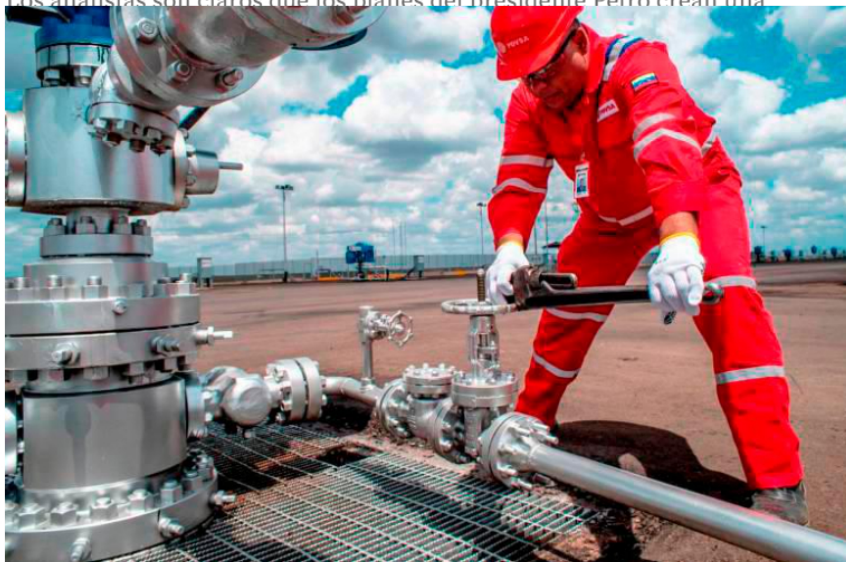
Expertos no ven con buenos ojos acuerdo del Gobierno colombiano con Venezuela.

Los analistas son claros que los planes del presidente Petro crean una