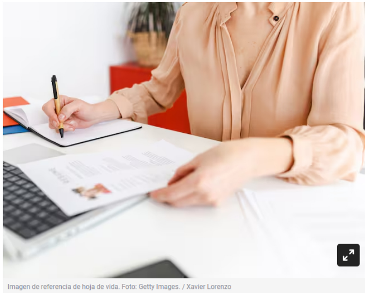
Imagen de referencia de hoja de vida.

Recuerde que todas las vacantes y procesos de selección de personal de Ecopetrol son gratuitos y se publican a través de la página web: www.ecopetrol.com.co .