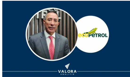
Colombia reconoce grave déficit de gas natural: este es el plan de Ecopetrol para enfrentarlo

Ecopetrol informó que avanza en la ejecución de la hoja de ruta 2024-2034 que busca garantizar el abastecimiento de gas natural en Colombia: con un plan que contempla la maximización de la producción en el interior del país y costa afuera en el Caribe, además de la importación del energético.