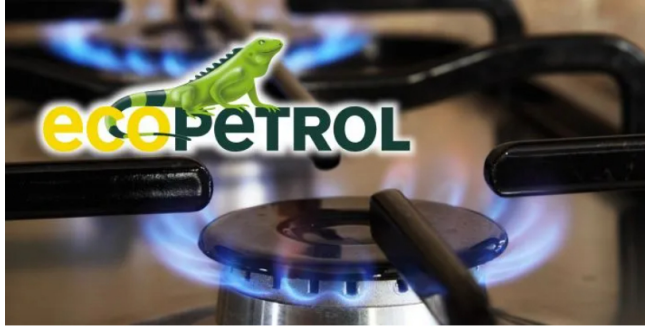
Ecopetrol confirma déficit de gas en Colombia a partir de 2025.

Mientras Ecopetrol dice que a partir del segundo semestre de 2025 empezaría a importarse gas de Venezuela, Andesco dice que el proceso tardaría más.