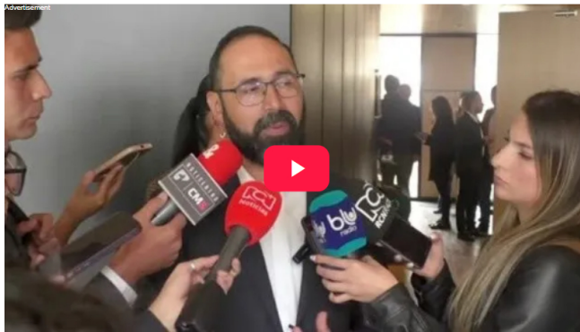
Andrés Camacho, ministro de Minas y Energía.

"Estamos trabajando en un decreto y en resoluciones que están en desarrollo para garantizar el uso anticipado de algunas moléculas de gas off shore y habilitar mecanismos para que tengamos mayor contratación y de esa manera, el próximo año, en 2026 y hacia adelante, podamos garantizar la seguridad energética del país, en materia de gas", sostuvo el funcionario.