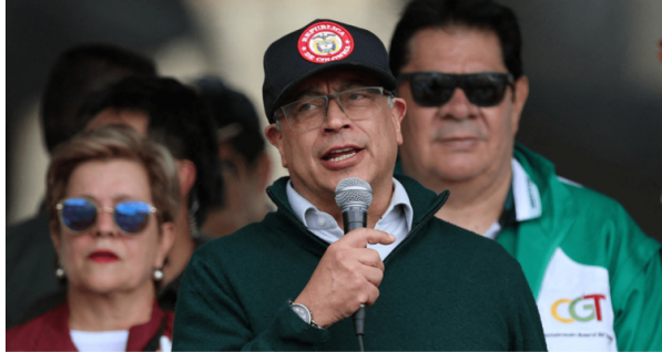
24 de julio, 2024 - 12:24 pm «Estamos importando gas desde hace años y se asegura que se pierde la soberanía si el gas proviene de Venezuela y el propietario de ese gas se llama Luis Carlos Sarmiento», sostuvo el presidente de Colombia, Gustavo Petro

El presidente colombiano, aseguró que el gas importado actualmente por Barranquilla vale cuatro veces más que el gas que está al pie de la frontera Petro reiteró que Colombia debe comprarle gas a Venezuela y no a EE. UU. porque es más barato