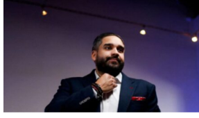
Nicolás Maduro Guerra, hijo de Maduro: «Si Edmundo González gana, entregamos y seremos oposición»

Refinería india Reliance recibió aprobación de Estados Unidos para reanudar la importación de petróleo de Venezuela, según Reuters