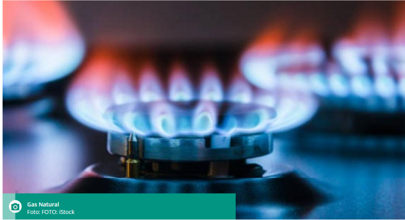
Gas Natural

La compañía potenciará producción, exploración e importación del energético, garantizando suministro para 40 millones de colombianos hasta 2034