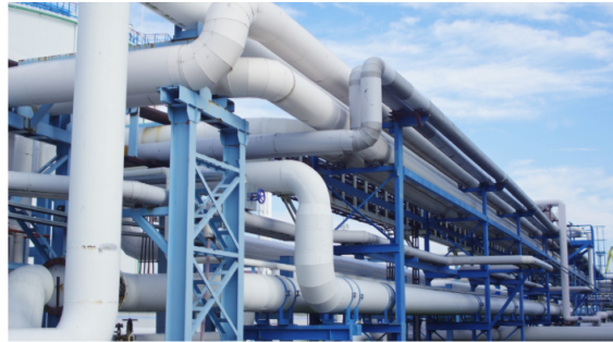
Para afrontar esta problemática, desde Ecopetrol se viene trabajando en acuerdos para la importación de gas a nivel nacional.

Publicado: Miércoles, Julio 24, 2024 - 13:03 | Actualizado: Miércoles, Julio 24, 2024 - 13:04