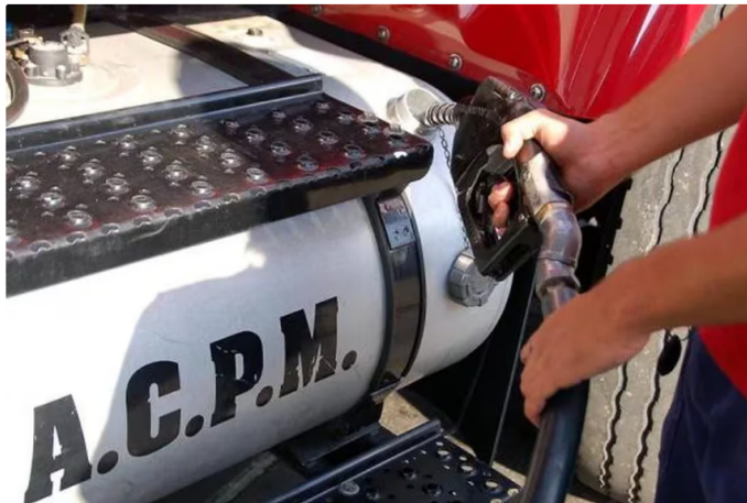
En la actualidad, el precio promedio del ACPM es de $9.614

El precio de los combustibles se volvió un asunto bastante sensible en Colombia y más teniendo en cuenta la alta inflación (7,18% interanual en junio de 2024). El valor promedio a nivel nacional del galón de la gasolina corriente en la actualidad es de $15.862, cifra a la que llegó tras varios aumentos mes a mes para cerrar el billonario déficit del Fondo de Estabilización del Precio de los Combustibles (Fepec).