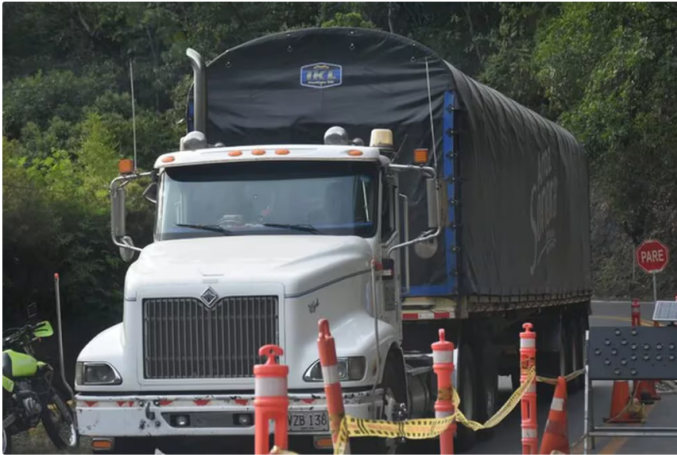
Los transportadores de carga insisten en que subir el precio del ACPM impactará la inflación

Este ajuste es significativo dado que el déficit previamente se ubicaba en cifras más altas. "Si esta medida entra en vigor en agosto, se espera una reducción en el déficit estimado para el cierre del año, que podría disminuir de 8 billones de pesos a un rango entre 1,8 billones y 2,4 billones de pesos", añadió Roa.