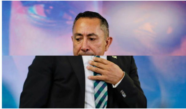
El presidente de Ecopetrol, Ricardo Roa, se refirió a las alternativas para el abastecimiento de gas en el país a corto y mediano plazo.

El presidente de Ecopetrol elevó la proyección del déficit para el próximo año desde 83 Gbtud (Giga BTU por día) hasta 120 Gbtud y para 2026 a casi 300 Gbtud.