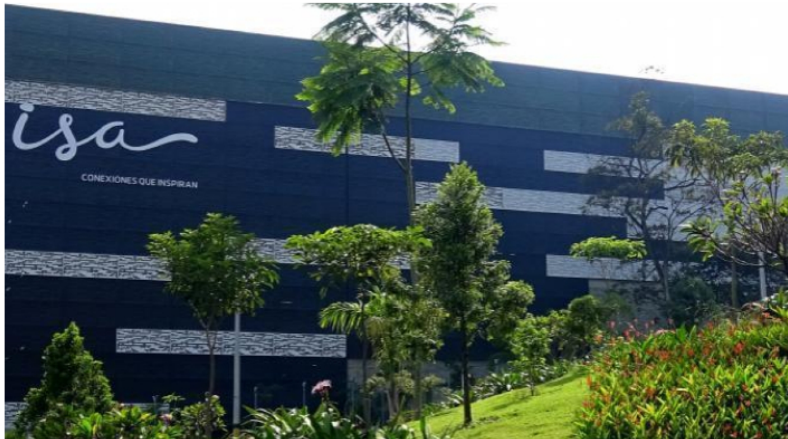
Grupo ISA Grupo ISA

Publicado: Martes, Julio 23, 2024 - 14:22 | Actualizado: Martes, Julio 23, 2024 - 14:22