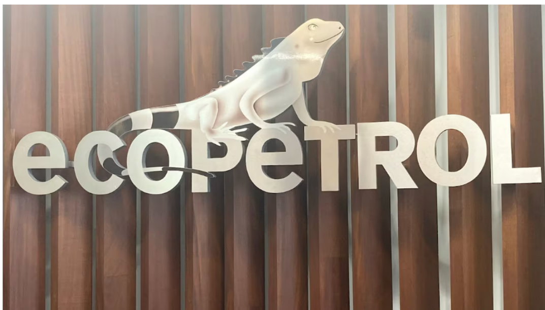
Hay vacantes en varias ciudades.