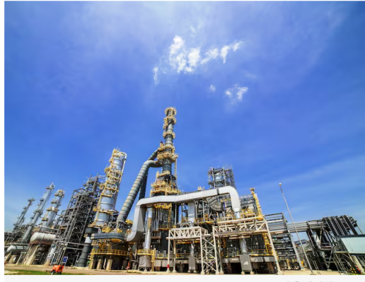
Refinería de Cartagena

En el punto más alto de la actividad se contratará alrededor de 1.500 trabajadores, con prioridad en la mano de obra cartagenera