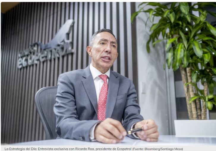
La Estrategia del Día: Entrevista exclusiva con Ricardo Roa, presidente de Ecopetrol

Hoy estamos al aire y en exclusiva con Ricardo Roa, el presidente de Ecopetrol, la empresa más grande y más importante de Colombia, quien confirma que están evaluando, además de Venezuela, estas alternativas para importar gas