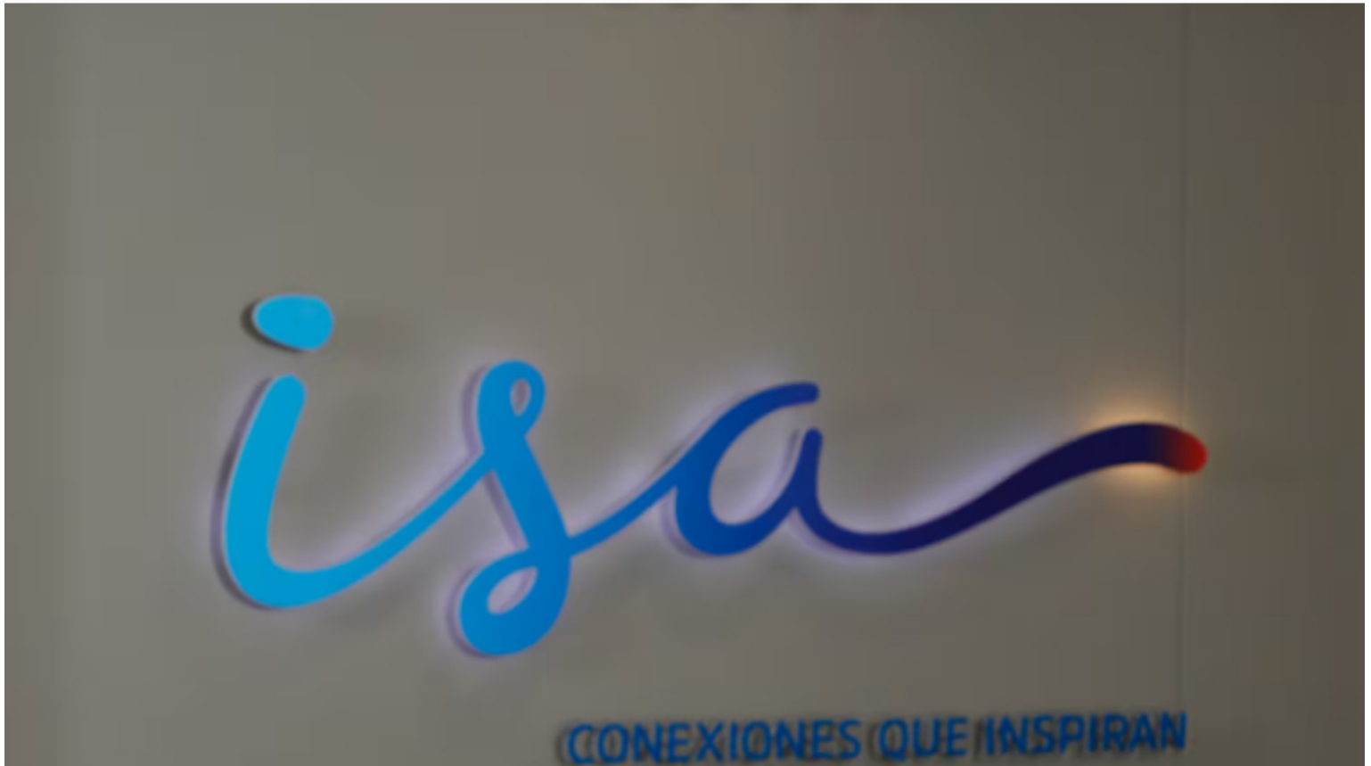
Logo ISA