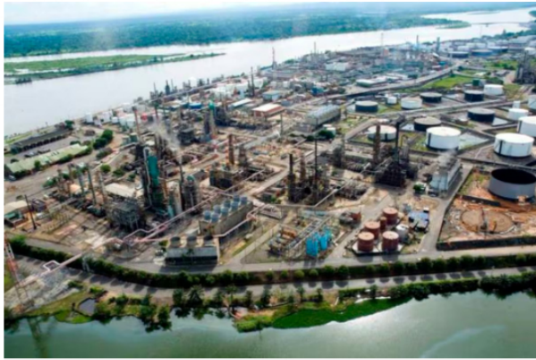
Vista aérea de la Refinería de Barrancabermeja