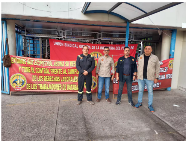
Al menos 200 trabajadores de un contratista de Ecopetrol protestan en las afueras de la Refinería de Barrancabermeja

En la otra misiva enviada el 18 de julio al Ministerio de Trabajo,