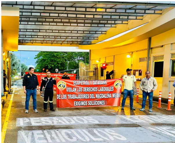
Al menos 200 trabajadores de un contratista de Ecopetrol protestan en las afueras de la Refinería de Barrancabermeja

Al menos 200 trabajadores de una empresa contratista de Ecopetrol bloquean las entradas de la Refinería de Barrancabermeja, exigiendo garantías laborales.