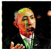
RICARDO ROA PRESIDENTE DE ECOPETROL

El Grupo Ecopetrol, al mando de Ricardo Roa, confirmó las negociaciones con Occidental Petroleum, para la eventual adquisición de una participación sobre los activos de propiedad de la sociedad CrownRock, con sede en Estados Unidos.