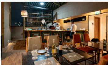
Noticias de Medellín