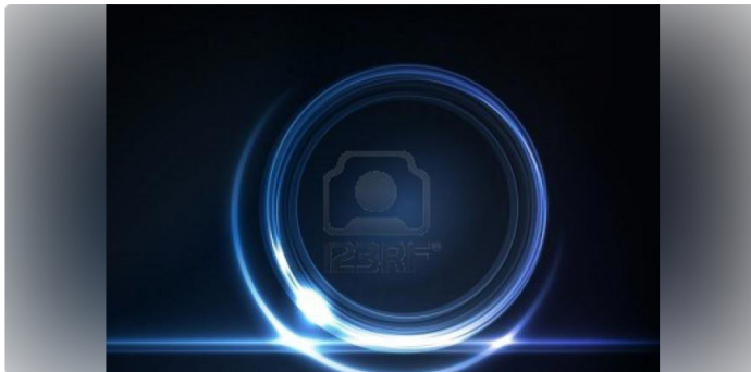
Ecopetrol © Proporcionado por El Tiempo

Actualmente, los vehículos eléctricos están ubicados en las refinerías de Barrancabermeja y Cartagena, y en las operaciones de Casanare, Meta, Rubiales, entre otras.