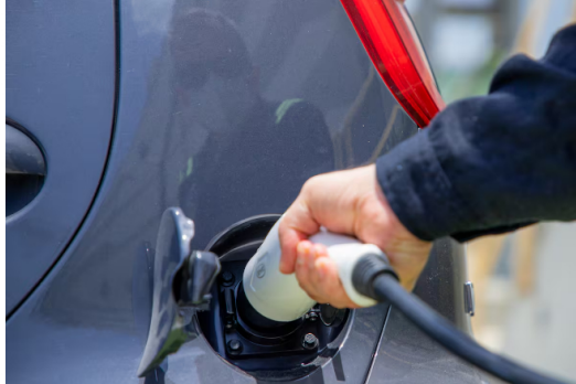
Estos vehículos han recorrido, desde el 2023, más de 2,5 millones de kilómetros, generando emisiones por 403 toneladas de gases efecto invernadero.

De 1.153 vehículos destinados al transporte de sus trabajadores en las diferentes instalaciones, el 33% corresponde a flota eléctrica.