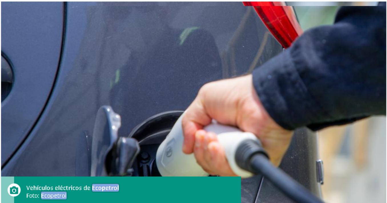
Vehículos eléctricos de Ecopetrol

Esto implica una reducción en las emisiones de de 47% frente a tener estos vehículos a combustión interna.