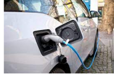
Vehículos eléctricos

Incorporación de 385 vehículos eléctricos logra disminuir 364 toneladas de CO2 equivalente en operaciones de la empresa.