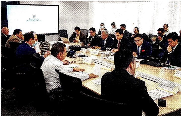
Departamento Nacional de Planeación

El Órgano Colegiado de Administración y Decisión, Ocad Paz, adelantó la sesión 73 que aprobó proyectos para el desarrollo de municipios; se acordaron los términos para ejecutar un concurso y también la propuesta de reactivación económica y de generación de empleo. En principio, se aprobaron 30 proyectos, que tendrán inversiones de $270.763 millones por concepto de asignación de paz. (MM)