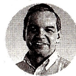
Ricardo Bonilla Ministro de Hacienda

Fedesarrollo publicó su encuesta sobre el Índice de Confianza del Consumidor. En el documento mencionan que en junio de 2024 el índice alcanzó un balance de -12,7%, lo que significa un repunte de 1,4% frente a mayo, lapso que obtuvo -14,1%. Es decir, la confianza mejoró levemente, pero sigue en terreno negativo. El centro de estudio mencionó que el resultado se debe a un alza de 6,1% en el Índice de Condiciones Económicas, que fue mitigado por una disminución de 1,7% en el Índice de Expectativas del Consumidor. Los resultados del segundo trimestre registraron una caída en la confianza de consumidores.