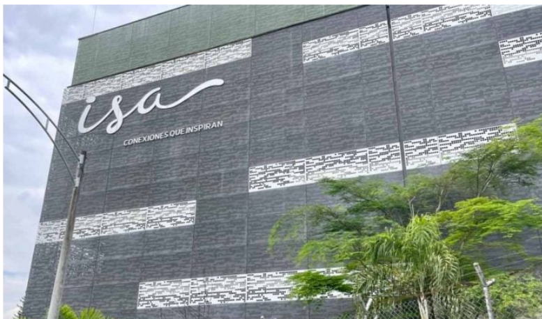
La puja para escoger al presidente de ISA: fechas y factores que lo definirán.