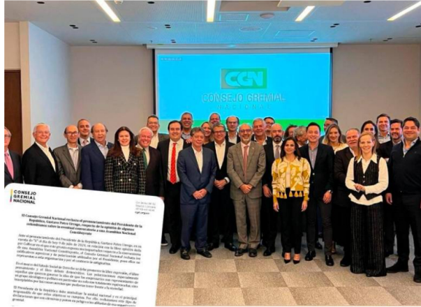
El Consejo Gremial Nacional rechazó las declaraciones del presidente de Colombia, Gustavo Petro, contra quienes opinan diferente sobre la Constituyente.

El llamado se dio luego de que el mandatario hablara de “extrema derecha”, tras un comunicado en el que el gremio de transportadores de carga expresara sus dudas sobre el proyecto.