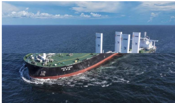
El barco está equipado con velas de fibra de carbono de alta tecnología, que aprovechan el viento como fuente de energía adicional, lo cual permite un ahorro de combustible de entre el 5% y el 8%.

Los dos millones de barriles de crudo, exportados por Ecopetrol en un barco híbrido, fueron cargados en el puerto de Coveñas y tienen como destino la India.