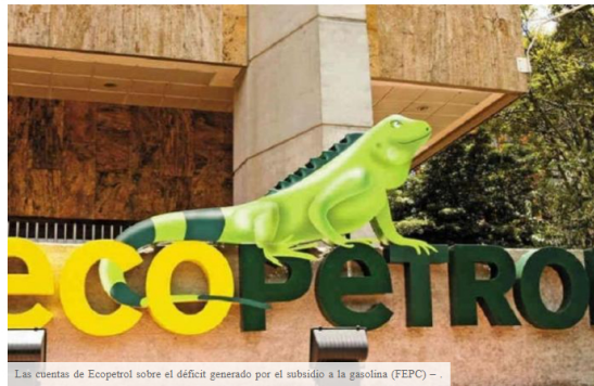
Las cuentas de Ecopetrol sobre el déficit generado por el subsidio a la gasolina (FEPC) -