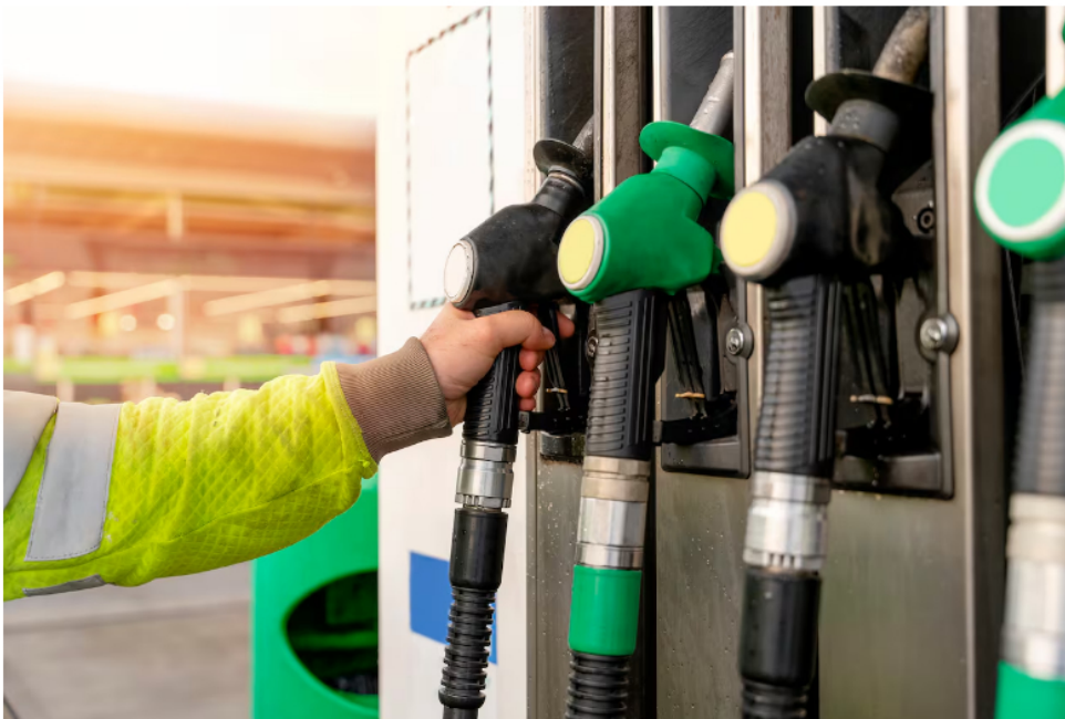
El desmonte de los subsidios al diésel se ha encontrado con dificultades como el alza en los precios internacionales de los combustibles y el aumento en la tasa de cambio.

Un informe del Grupo de Investigaciones Económicas del Banco de Bogotá señala que pese a la intención de reducir el déficit del FEPC la dificultad está en que para el Gobierno no ha sido fácil incrementar el precio del ACPM, no solo por las discusiones políticas, sino por un escenario actual de altos precios del petróleo y tasa de cambio devaluada.