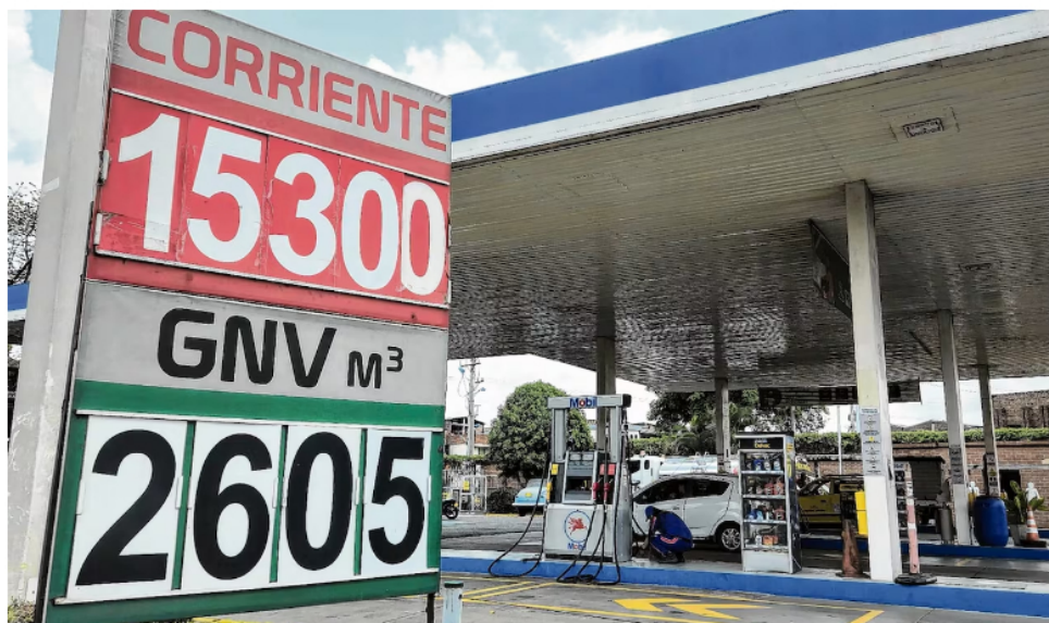
Los precios de la gasolina en Colombia ya se encuentran a nivel de los internacionales.

De acuerdo con el comunicado, al cierre de 2022 el saldo del FEPC fue de 36,7 billones de pesos, un año después era de 20,5 billones , gracias a los cambios en los precios de la gasolina y el diésel en el mercado internacional y a los precios aplicados a estos combustibles en Colombia. Vale la pena recordar que el actual Gobierno inició un proceso de desmonte de los subsidios a los combustibles que inició con la gasolina y que acaba de iniciar con el ACPM.