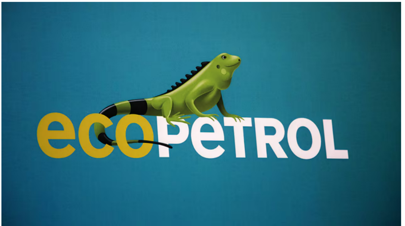
Al cierre de 2022 el saldo del FEPC fue de 36,7 billones de pesos, un año después era de 20,5 billones.

Tras la realización de una auditoría financiera a Ecopetrol por parte de la Contraloría para revisar las cuentas de la petrolera en 2023, el ente de control concluyó que las finanzas de la mayor empresa del país podrían estar en problemas por los pagos del Fondo de Estabilización de Precios de los Combustibles (FEPC) , con el cual el Gobierno financia los subsidios a la gasolina y al diésel.